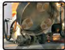
鏗基地坪施做機器