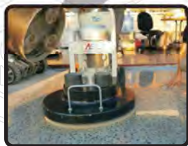
鏗基地坪拋光機器